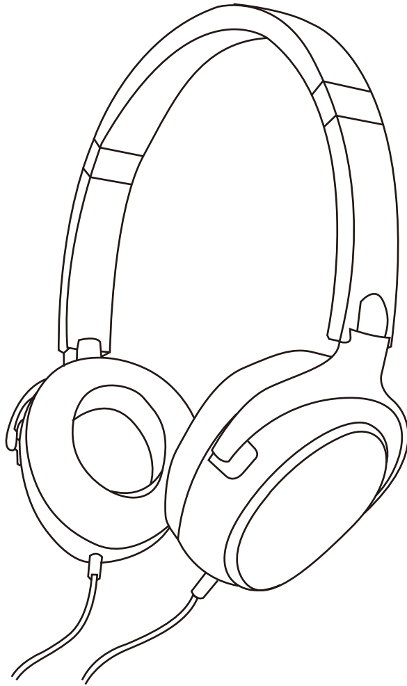
Klipsch R6 On-Ear ヘッドホン